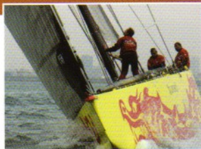
America's Cup China Team, le temps de l'apprentissage