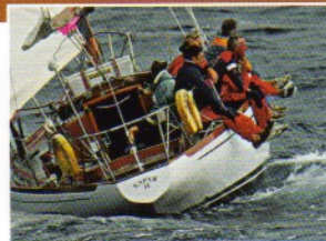
Espar II Une occasion séduisante